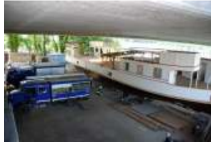
Die Fahrzeuge des THW sind positioniert.

Der Ablauf der Einwässerung wurde immer und immer wieder gedanklich durchgespielt. Ende Juni ging der Wasserstand bereits wieder zurück und hatte die Wunschmarke von 4,20 m längst unterschritten.