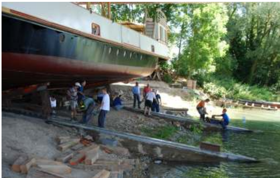
Kettenzüge werden angebracht um die Fähre in Richtung Rhein zu ziehen.

Am 28. Juni war es soweit. Gegen 7.30 Uhr trafen die ersten Fahrzeuge vom THW Konstanz und THW Singen auf der Werft ein, und wurden in Position gebracht.