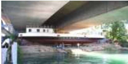
Fähre im Morgen des 28. Juni 2008

tiert werden. Begleitend haben Technischer Ausschuss, Vorstand, Mitarbeiter, Vertreter der Hilfsorganisationen und dem Leiter des Schifffahrtsamtes den Ablauf der Einwässerung eingehend besprochen und geplant. Die für die Einwässerung notwendigen Werkzeuge und Hilfsmittel mussten zusammengetragen und bereitgestellt werden. Die Fährebetriebe der Stadtwerke Konstanz, Bodanwerft und das THW, haben bereitwillig Werkzeuge und technische Einrichtungen beigesteuert.