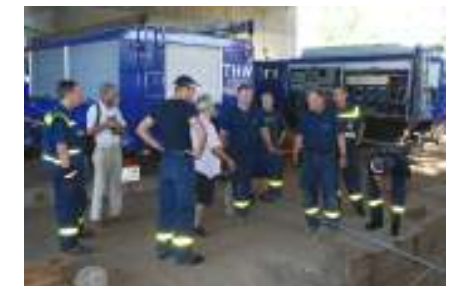
Lagebesprechung am Sonntagmorgen

Wieder wird die Fähre Zentimeter um Zentimeter auf der Slippanlage in Richtung Rhein verschoben. Inzwischen ist es Samstagabend 20.30 Uhr. Die meisten Beteiligten waren seit 12 Stunden fast ununterbrochen im Einsatz. Zu diesem Zeitpunkt war es nicht möglich abzuschätzen wie lange es noch dauern könnte, und man fasste den Entschluss am Sonntagmorgen die Arbeiten fortzusetzen.